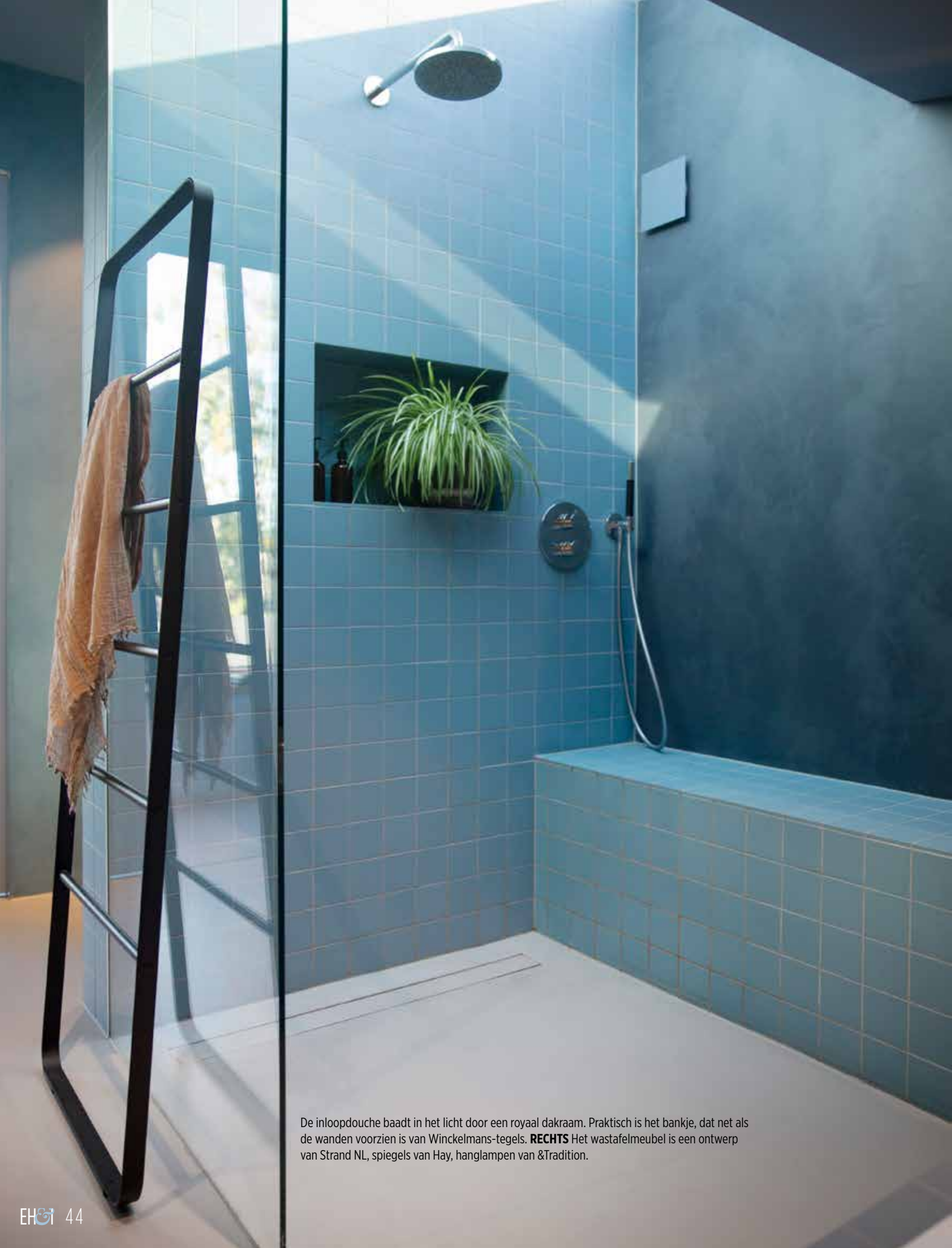
De inloopdouche baadt in het licht door een royaal dakraam. Praktisch is het bankje, dat net als de wanden voorzien is van Winkelmans-tegels. RECHTS Het wastafelmeubel is een ontwerp van Strand NL, spiegels van Hay, hanglampen van &Tradition.